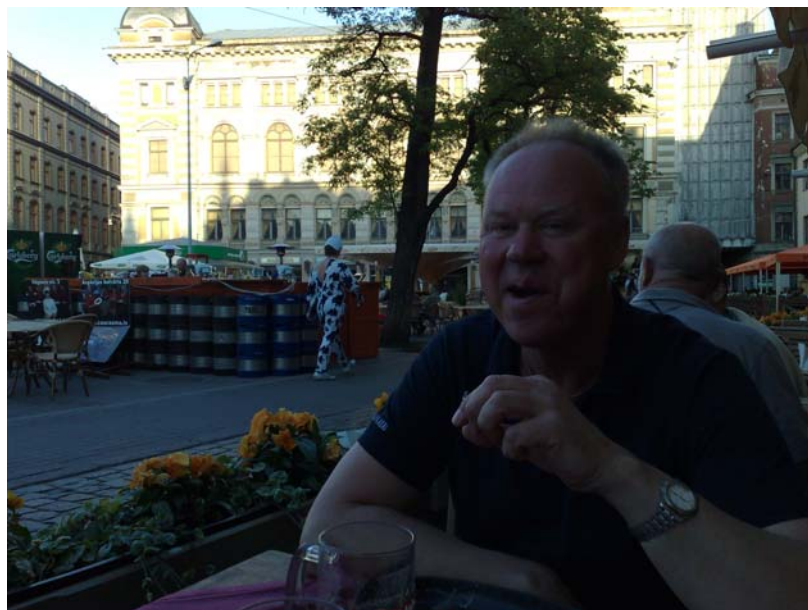
Vi hittar en uteservering som ser trevlig ut, vi flyttar runt gasolvärmarna så vi får det varmt och skönt, vår sång ekar glatt mellan borden.